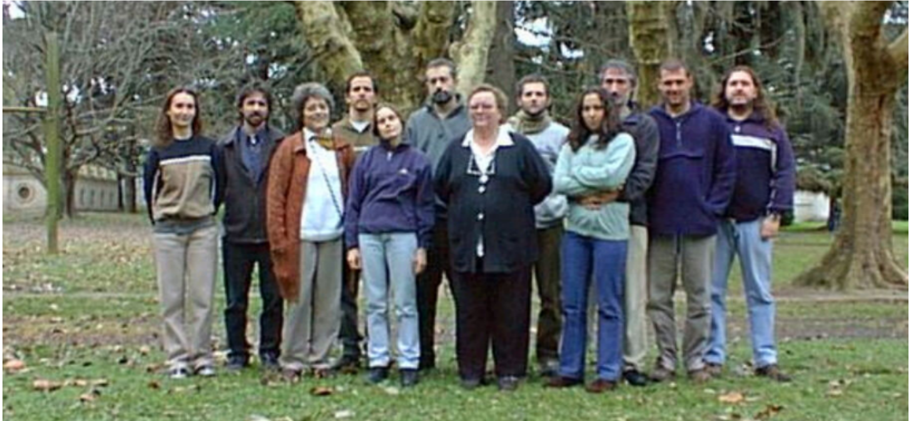
The Massive Stars Research Group at La Plata